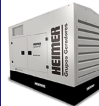
Gerador Cabinado com insonorização.