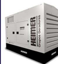
Gerador Cabinado com insonorização.